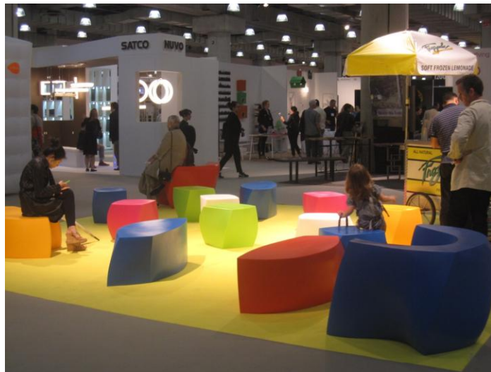
אחד מהחללים המרכזיים בתערוכה

טרנד הצבעוניות מטביע את חותמו כבר מספר שנים. חברות עיצוב רבות מהמובילות בעולם חברו למגמה זו ואפשר לראות כי שוק העיצוב מוצף בכיסאות, שולחנות, שידות ושאר רהיטים, בשלל צבעים. טרנד זה קיבל נוכחות מרשימה בתערוכה הן בחללים המרכזיים באולם והן בביתנים של החברות, שהציגו את חידושיהם.