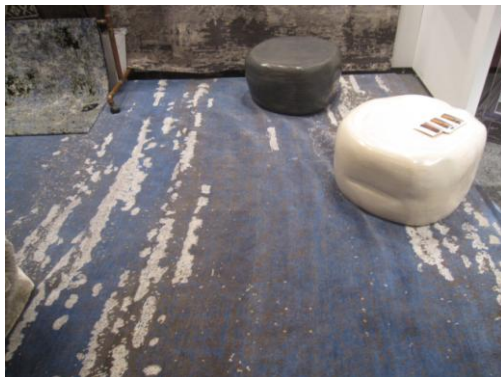
שטיח של חברת TIBETANO