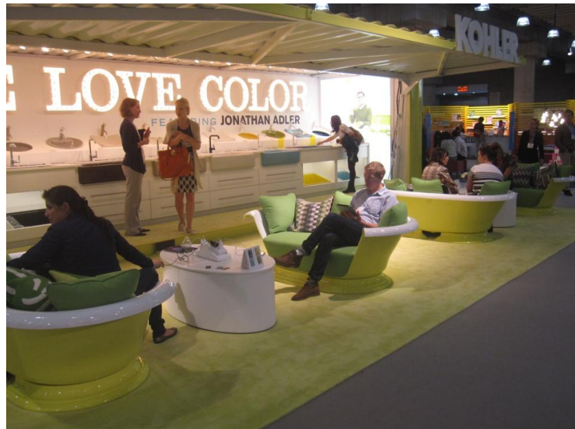
האמבטיות/ספות של חברת KOHLER

יתכן, כי החידוש בטרנד הצבעים שייך בעיקר לחברת KOHLER , שהכניסה את המגמה גם לתחום הסניטריה. בדוקן, שהעמידה ניתן לראות כיורים צבעוניים ושימוש באמבטיות בצבעי צהוב לימון כספות ישיבה. אין ספק, שהביתן של KOHLER הוא אחד הביתנים הבולטים והיפים בתערוכה.