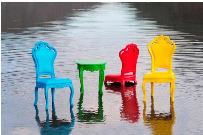
קולקציה רהיטי החוץ של חברת POLART

חברת POL ART הציגה בתערוכה קולקציית רהיטי חוץ שונה ומדליקה, שבהחלט עמדה בציפיות. שידות וספות בסגנון לואי 14, בצבעים נועזים ובאיכות מרשימה. אין ספק, כי רמת הצביעה הגבוהה, הגוונים, הירידה לפרטים והפיתוחים אכן יוסיפו שאו לכל גינה או מרפסת ויהפכו אותה למקום שמח ועכשווי, שכיף להתארח וכיף לארח בו