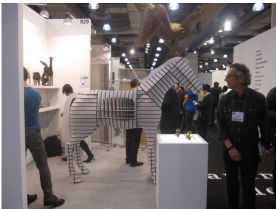
פסל ענק של D-torso

מגמה נוספת שבלטה בתערוכה היא השפעה זנית ובעיקר יפאנית, שנכחה בצורה ברורה בפרטי המעצבים. בעברי חייתי ביפן ואני יכולה לומר, כי מיד זיהיתי סממנים רבים מהתרבות היפנית, שמביאים איתם קלילות, אווריריות, מינימליסטיות, פשטות, שימוש בחומרים כמו עץ, פורניר, קרטון, קווי עיצוב נקיים, סדר מופתי ושימוש בצבעים בהירים. אפשר היה למצוא את זה בגופי התאורה שהציגה WEPLIGHT , בפסלים הצבעוניים של חברת Lladro , שמזכירים קומיקס יפני. כמו גם בפסלי הענק מקרטון של d-torso , המשרים אווירה קלילה עם נגיעה בעולם הדמיון.