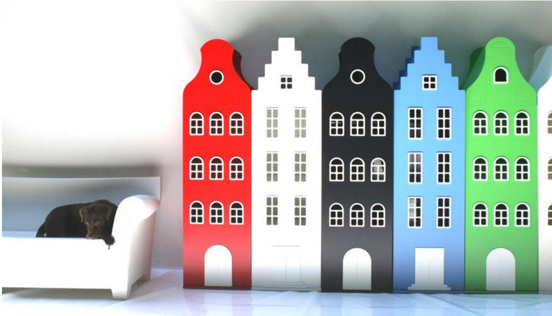
ארונות איחסון של החברה ההולנדית COOL KIDS

חברה נוספת, שהציגה את הטרנד היא חברת היוקרה ההולנדית COOL KIDS לריהוט חדרי ילדים. החברה בחרה להציג ארונות בגדים בצורת בניינים בשילוב שלל צבעים עליזים כמו אדום מסטיק, בייבי בלו, ירוק תפוח וורוד ילדותי. לא זול אפילו יקר אבל מדהים!