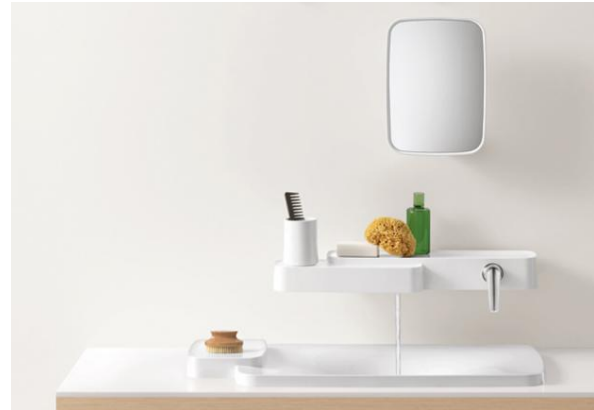
FEEL FREE TO COMPOSE –AXOR

ריענון נוסף בתחום הסניטריה הציגה חברת AXOR שיצאה עם ליין אשר מאפשר יצירתיות אין סופית בהעמדת המרכיבים בחדר הרחצה, מה שנותן דרור לעיצוב אחר, המתאים באופן אישי לנוחות הלקוח.