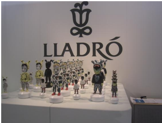
פסלי הקומיקס של Lladro