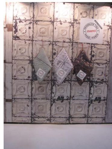
טפטים של חברת NLXL